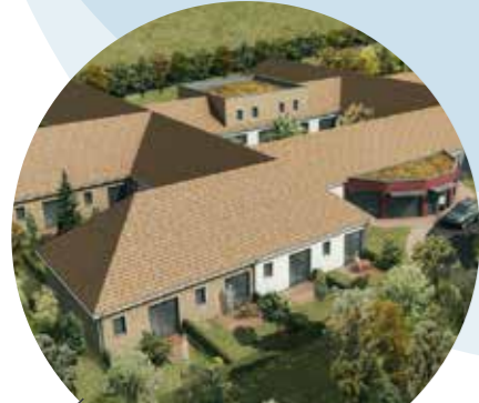
logements personnes âgées - maison de retraite