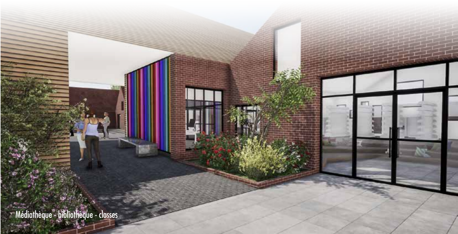
Médiathèque - bibliothèque - classes