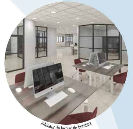
intérieur de locaux de bureaux