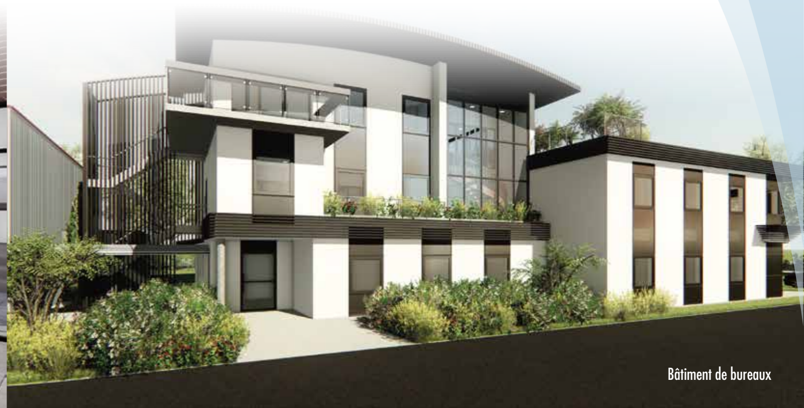
Bâtiment de bureaux