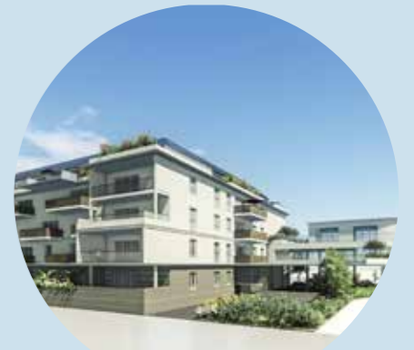
logements et locaux de bureaux