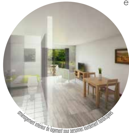
aménagement intérieur de logement pour personnes lourdement handicapées

Étudier, en collaboration avec les collectivités et les acteurs privés, les possibilités d'urbanisation de parcellaire en vue de la création d'un aménagement de qualité.