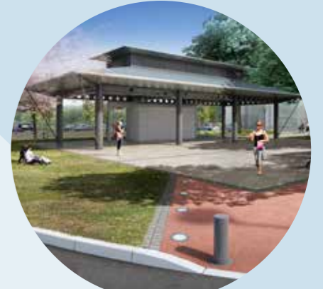
aménagement urbain et public