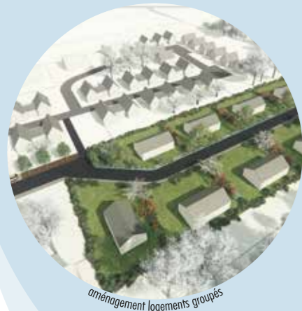
aménagement logements groupés